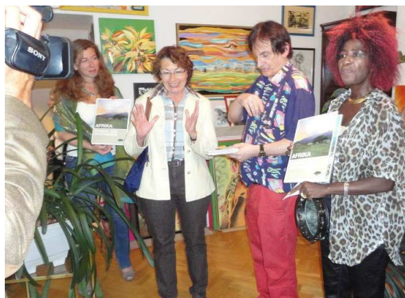
12. Mai 2012 – Africa meets Kunsthaus Rumpf/Wien