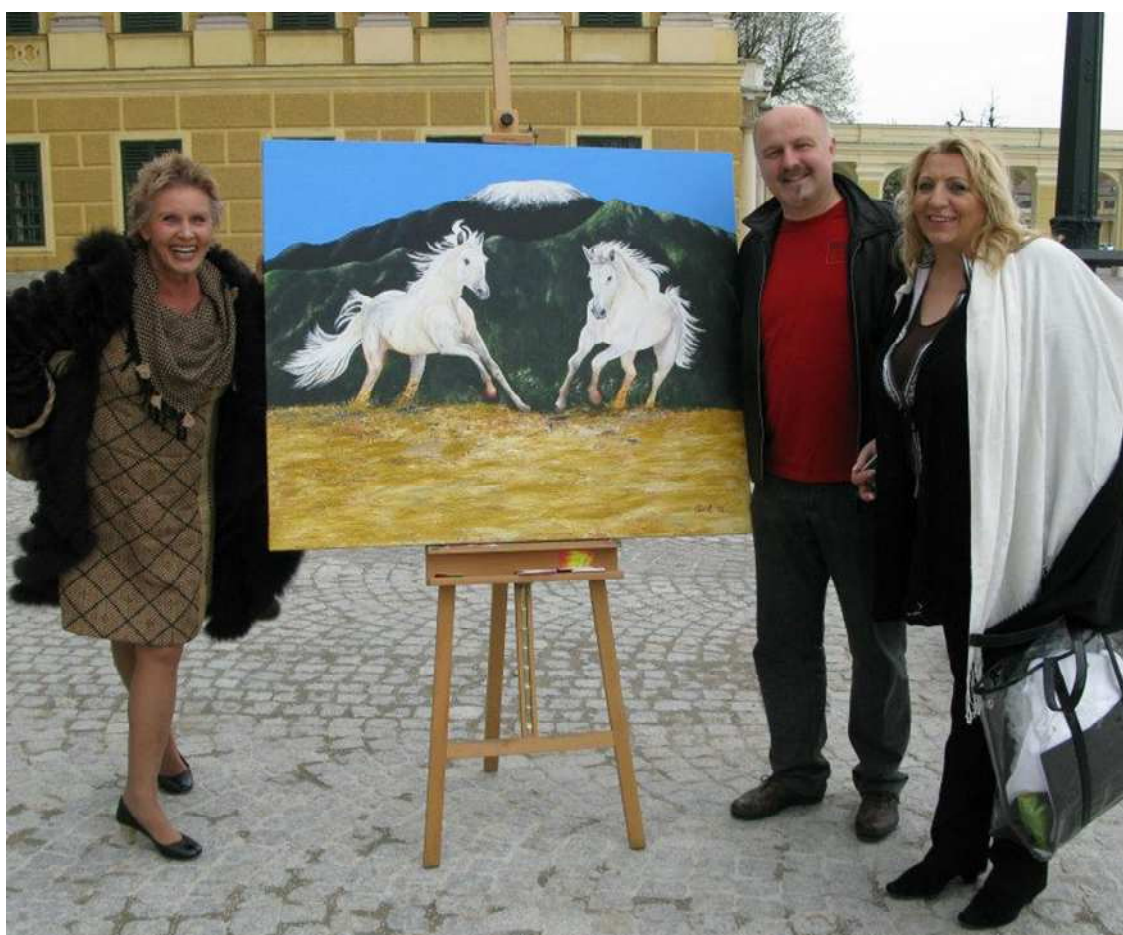
14. April 2012 – KUNST IN BEWEGUNG vorm Schloss Schönbrunn in Wien

Liebe besteht nicht darin, dass man einander anschaut, sondern dass man gemeinsam in dieselbe Richtung blickt.