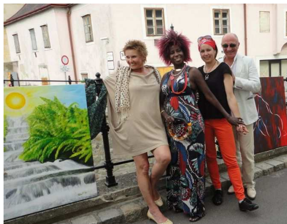
11. Mai 2012 – Africa meets Klosterneuburg