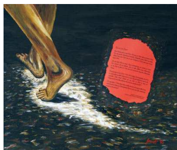
Spuren im Sand

Diese Bilder finden den Weg nach Africa/Tansania zu Africa Amini Alama und werden Freude, Motivation, Inspiration, positive und heilende Energien in das Kunsthaus und in die Krankenstation bringen.